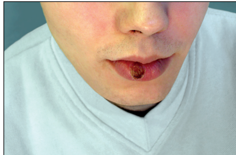
Ryc. 1. Zlokalizowany na wardze objaw pierwotny w przebiegu kiły I okresu.

krętków, czyli na penisie, na skórze okolic odbytu, w kanale odbytu, w jamie ustnej lub na palcach ręki. Może też wystąpić powiększenie węzłów chłonnych. Nieleczony objaw pierwotny samoistnie zanika w ciągu 3-6 tygodni.