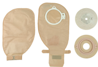
Ryc. 11. Worek i płytka (system dwuczęściowy) do ileostomii w systemie otwartym.

Worki stomijne mogą być otwarte lub zamknięte. W przypadku worków zamkniętych wymiana worka następuje po każdorazowym wypełnieniu. Worki otwarte dają możliwość opróżniania worka z treści jelitowej i prawidłowo umocowane mogą pozostawać na stomii 3-4 dni. Przykładowy worek stomijny w systemie otwartym przedstawia Ryc. 11.