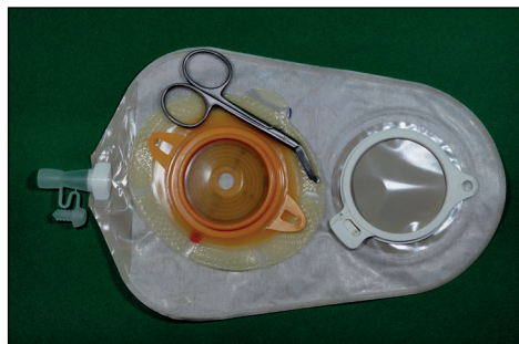
Ryc. 13. Worek do urostomii w systemie dwuczęściowym.

Worki do urostomii zaopatrzone są w ujście z kurkiem, umożliwiające częste opróżnianie worka. Przykładowy worek dwuczęściowy do urostomii przedstawiono na Ryc. 12.